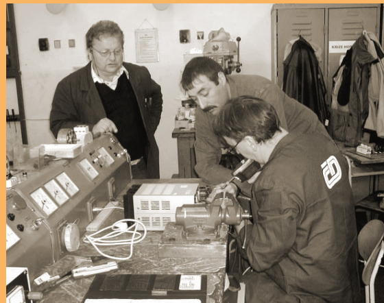
ŠKOLA POSKYTUJE MOŽNOST REKVALIFIKAČNÍHO A DÁLKOVÉHO STUDIA