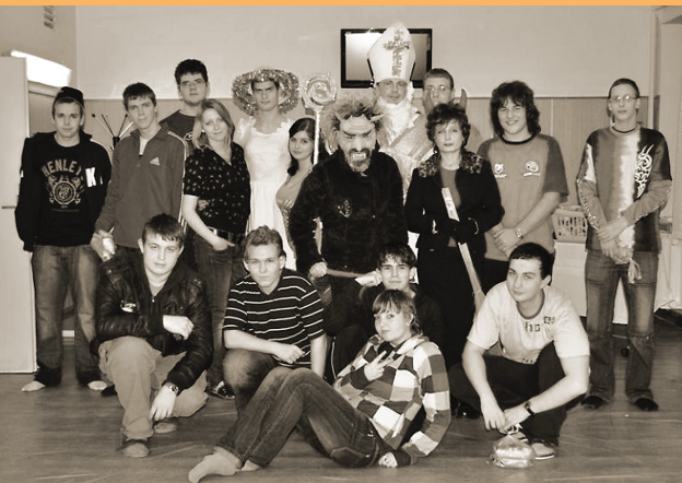
DOMOV MLÁDEŽE PROSINEC 2010