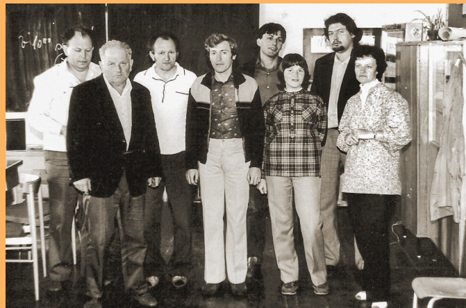
UČITELSKÝ SBOR, 70. LÉTA

čené množství válečných zajatců, vojáků a cestujících, kteří se v okamžiku náletu zdržovali na nádraží nebo kteří byli internováni v jeho blízkém okolí. I této hrůzy mohlo být město ušetřeno, nebýt té někdy smrtící, jindy však opět zase životodárné, zkrátka osudové železnice.