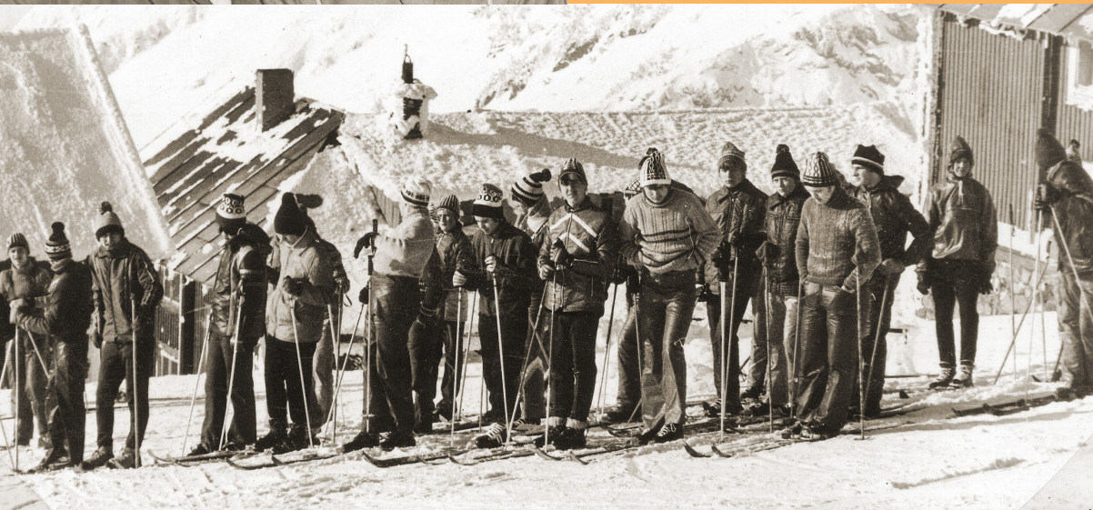
LYŽAŘSKÝ VÝCVIK, KRKONOŠE 1978