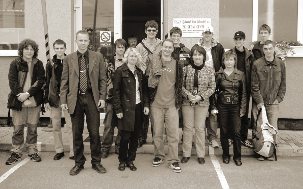
NA EXKURZI, VELIM 2010