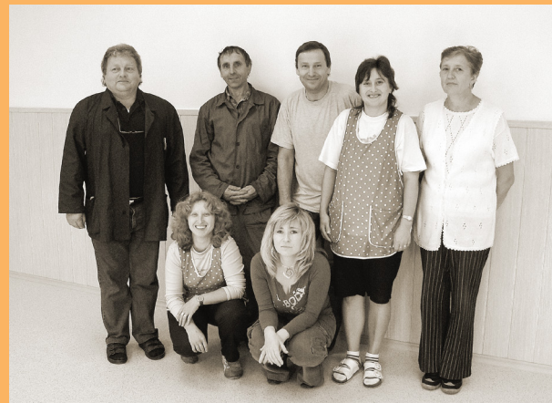
ÚSEK ODBORNÉHO VÝCVIKU, 2004