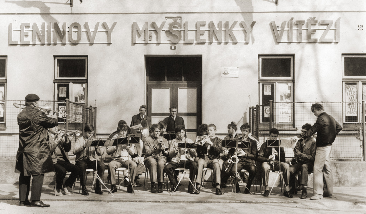
STUDENTSKÁ KAPELA, 1.MÁJ 1972