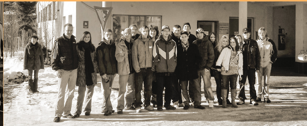
NÁVŠTĚVA ŽOS ČESKÉ VELENICE PROSINEC 2010